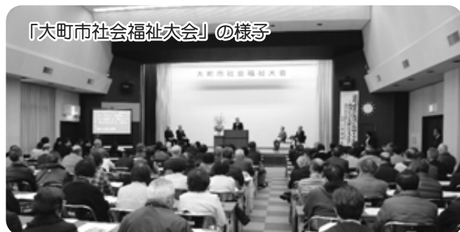
「大町市社会福祉大会」の様子

法人会員は引き続き募集中です。皆さまのご支援・ご協力をよろしくお願いいたします。