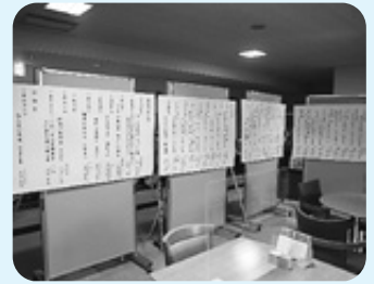
福祉啓発標語募集