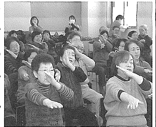
「北国の春」で歌体操

ボランティア活動保険は、ボランティアがボランティア活動中の事故によりケガをした場合や、他人の物を壊したことにより損害賠償責任を負わされた場合に、保険金が支払われます。また、ボランティア活動場所と自宅との往復途上の事故や熱中症、ボランティア自身の食中毒や特定感染症も補償されます。