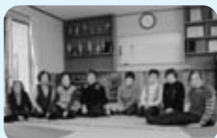
小地域福祉ネットワーク 東中原町なずなの会 会員の皆さん

東中原町では、もともと自然な隣近所の支え合いがあると思う。日常的に、燃えるごみや資源ごみ等は互いに助け合い、ごみステーションなどに持っていくことをしている。雪かきはその延長。