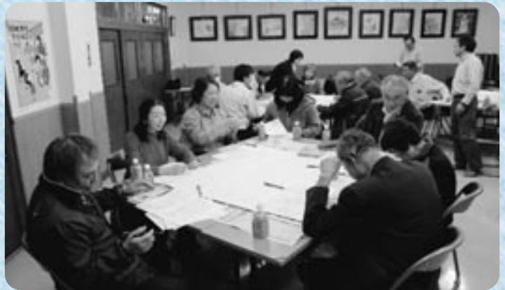
グループごとにテーマを選択し意見交換