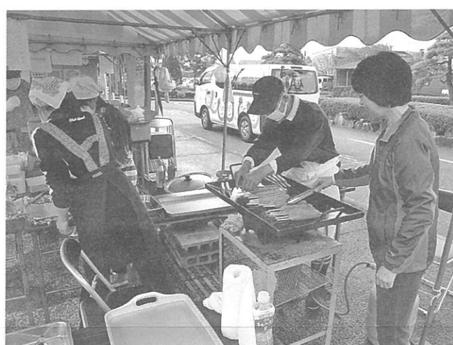
2017 フランクフルトコーナー

9月29日(土)と30日(日) 国営アルプスあづみの公園大町・松川地区で、「北アルプスフェア2019」が開催されます。大田市社協では、「昔遊び広場」を担当します。このコーナーでは、来