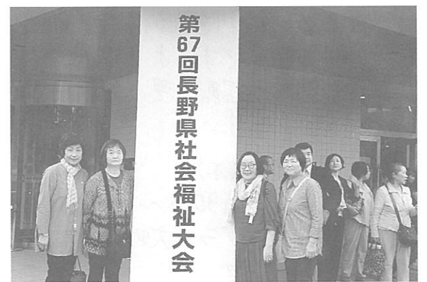
第67回長野県社会福祉大会

また、民生委員児童委員活動に貢献された9人の方々も、長野県社会福祉協議会会長表彰を受けられました。