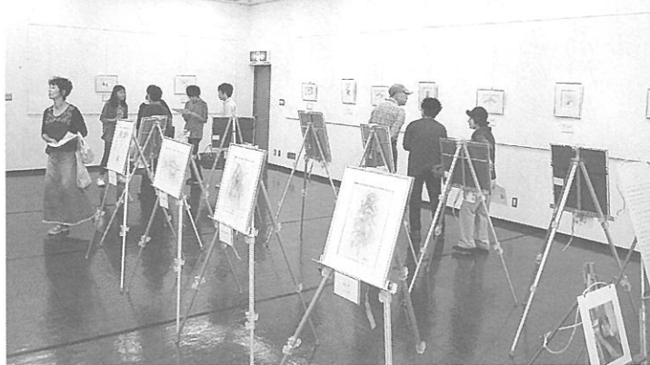
市民ふれあい広場の絵画展