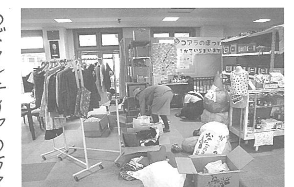
コアラのぽけ仕分けボラ

羽根共同募金に寄付されます。また、鹿島荘輪投げコーナーと社協コーナーで義援金をお願いしたところ、8747円のご協力をいただきました。この義援金は、東日本大震災・熊本地震災害・7月豪雨災害・北海道胆振東部地震災害の復興に役立てていただくよう送金します。