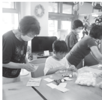
てるてる坊主を作る