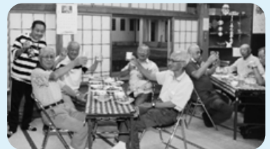
居酒屋こだま(8月26日) 普段の行事は女性の参加が多いが、男性参加者も増える。「久しぶりに開いてくれてうれしい」「一人よりみんなでいると楽しい。」「元気だったかい?」との会話ははずむ

コロナ禍で三世代交流や介護施設でのボランティアは中止にしてきたが、一人暮らしの方へのおはぎの配布や、12年位前から続いている布切ボランティアは継続し介護施設へ届けている。皆が元気に集まれるようこれからも活動を継続していきたい。