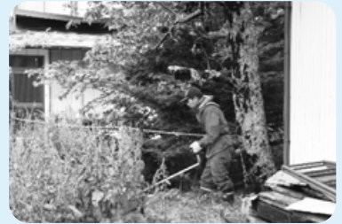
会員で協力し草刈り作業も行う

「花見地区を良くしよう」と毎月第2土曜日に道路や不在者宅周辺の草刈りをしたあと定例会を開いている。今年の夏も子どもも大人も一緒に、わんぱく広場、向日葵の背比べ、ラジオ体操に取り組み交流を深める。秋にはそばまつりを開き近隣から大勢の参加者が来てくれる。今後も地域の交流の機会、見守りのある地域づくりを進めていきたい。