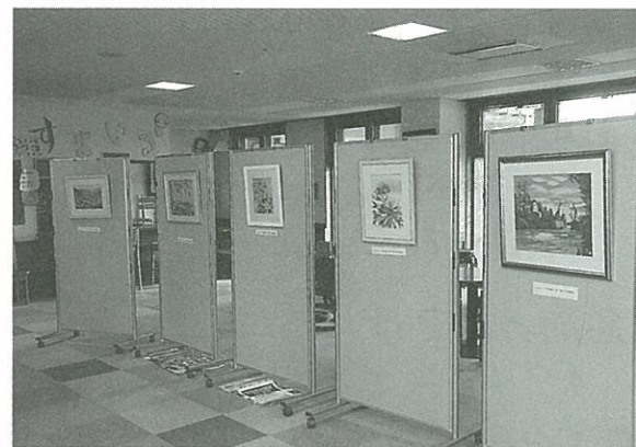
現在ちぎり絵 展示中

大町市ボランティアセンターでは、誰でも気軽にできるボランティアとして、収集ボランティア活動や募金や義援金の協力をお願いしています。