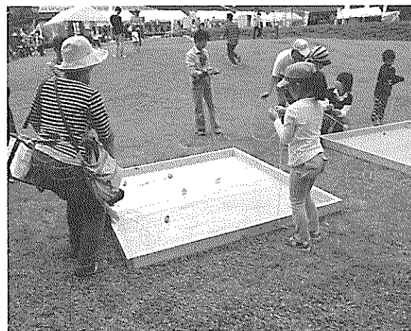
「昔遊び広場」コマ回し

9月30日(金) 障がいのある方々の希望の旅が行われ、お出掛けボランティア講座パート2を受講された5人の方々に、介助ボランティアとして参加していただきました。行先は、群馬県嬬恋村、浅間火山博物館。バスの中や風食・買い物など、ボランティアのみなさんと楽しく過ごすことができました。ボランティアからは「参加者が、明るくお互いに支え合う姿に感動した」と感想をいただきました。