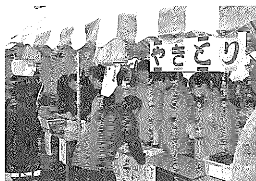
やきとり・フランクフルトコーナー

10月8日(土) 市民ふれあい広場の社協コーナーで、やきとりとフランクフルトの販売を行いました。あいにくの小雨模様でしたが、大勢の皆さんに来ていただき完売しました。また、義援金をお願いしたところ、東日本大震災50円・熊本県地震災害60円・岩手県台風大雨等災害50円のご協力をいただきました。この義援金は、各被災地の復興に役立てていただくよう送金します。ありがとうございました。